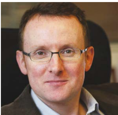
Guillaume REBIÈRE Rédacteur en chef du Journal du Dimanche

D'une part, l'acquisition de compétences neuves sur les pratiques du journalisme Web : maîtrise des réseaux sociaux pour veiller ou diffuser une info, construction d'un article de fact-checking , compréhension des outils du journalisme mobile, des codes de l'iconographie en ligne. D'autre part, la création d'un véritable média local, dont chaque étudiant pourra revendiquer la paternité, qui lui servira de « carte de visite » pour l'entrée sur le marché du travail journalistique, et qui sera une mise en application immédiate des enseignements précédents. Ce cadre encourage chaque étudiant à multiplier les sorties sur le terrain, à créer puis entretenir un réseau de contacts. »