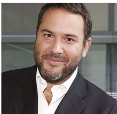
Bruce TOUSSAINT Présentateur de C dans l'air sur France 5

Enseigner la radio est passionnant. Transmettre ses connaissances, et voir évoluer des journalistes en herbe acquérir petit à petit des réflexes est très intéressant. Au-delà de la technique, il y a l'envie d'éveiller leur curiosité au monde et aux autres ainsi que d'inoculer le virus du journalisme. Chaque année, je vois au cours de la formation les étudiants franchir un cap. La plupart sont déjà aguerris mais nous faisons un vrai travail en profondeur qui nous permet de franchir un nouveau palier. Je pense sincèrement que les étudiants sont performants et entièrement opérationnels à la sortie du M1.»