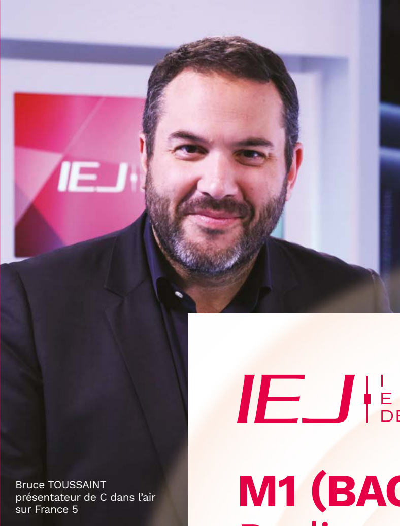
Bruce TOUSSAINT présentateur de C dans l'air sur France 5