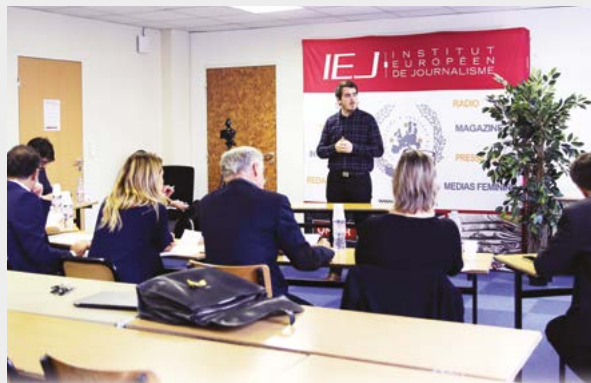
Détection de Talents organisée pour les M1 Presse écrite / Internet en présence de recruteurs de grandes rédactions